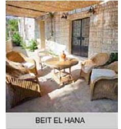
BEIT EL HANA

Albergue o casa local tradicional, con habitaciones dobles con baño compartido o privado (según disponibilidad). Dependiendo del tamaño del grupo se puede dormir en una casa anexa con gran encanto. Dispone de sábanas, mantas, agua caliente y todos los servicios de un hotel