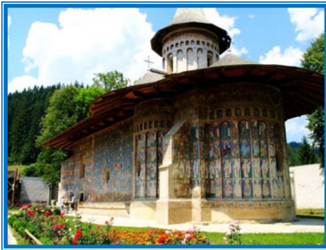
Bucovina 4* . (D.A.C)